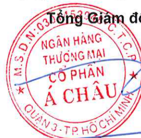
Từ Tiến Phát