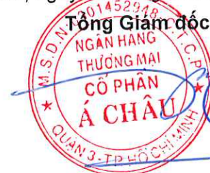
Từ Tiến Phát