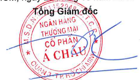
Từ Tiên Phát